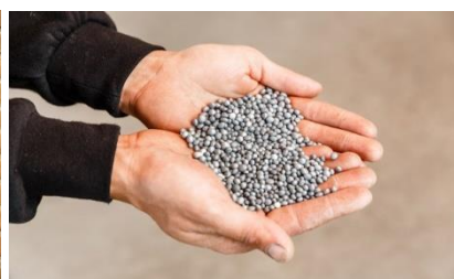
HR +++ grijze grafiet pixels ovaal